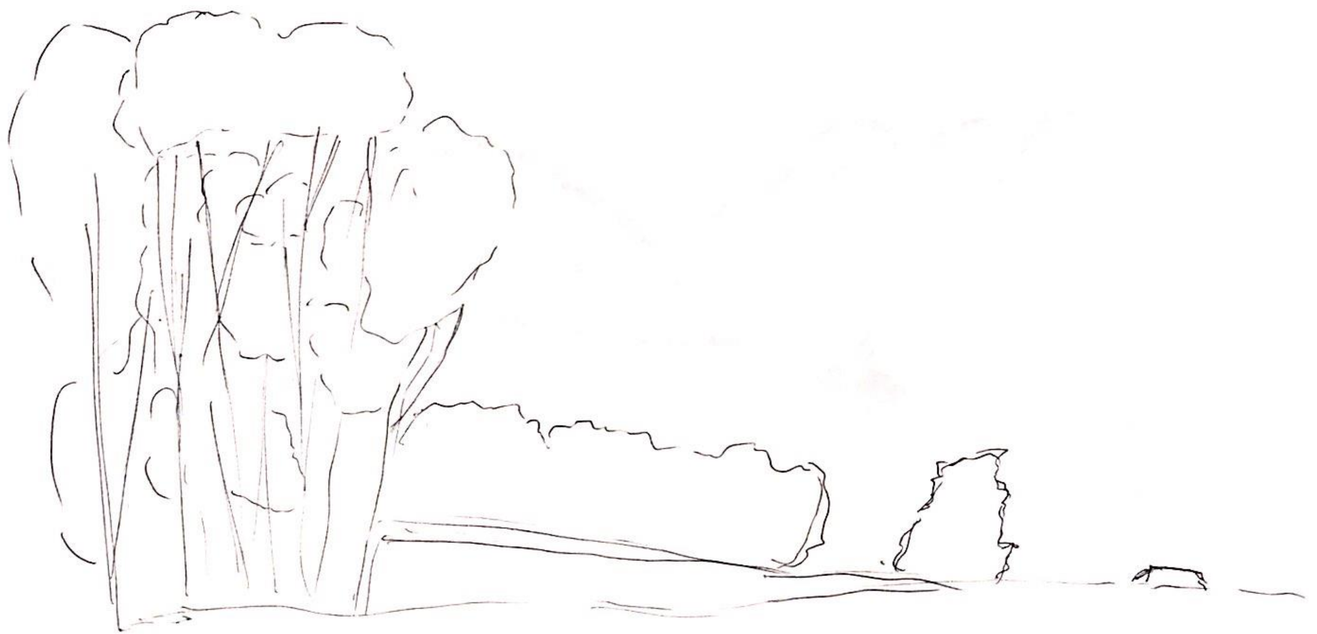
101. Los árboles terminan para llegar a otros más pequeños, se nota el cambio brusco entre los árboles y lo llano.