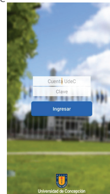
Plataforma para teléfono móvil de UdeC