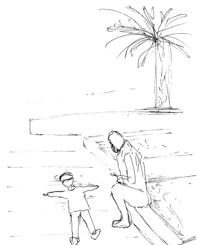
107. En lo amplio y libre del suelo de la plaza, el niño se despliega sobre él a modo de juego, su cuidador mientras se sienta sobre la orilla de una decoración para verlo de mejor manera para también participar de lo que hace el niño y hablar y reír.

110. En la explanada de la calle , la joven se acerca a la anciana para ayudarla a cruzar. Una distancia muy próxima entre ellas sobre lo amplio del suelo, marcando un motivo y elección a este acercamiento .