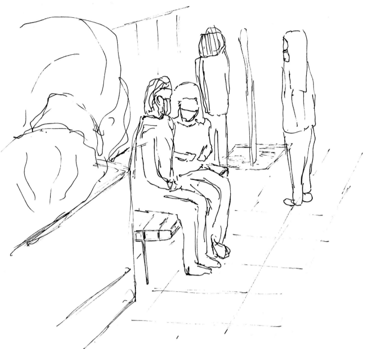
104. La disposición de los cuerpos y las miradas enfocadas en la otra hace parecer que está en una burbuja de intimidad en la amplitud de la calle. La conversación y las risas siguen sin importar el alrededor.

104. La disposición de los cuerpos y las miradas enfocadas en la otra hace parecer que están en una burbuja de intimidad en la amplitud de la calle . La conversación y las risas siguen sin importar el alrededor.