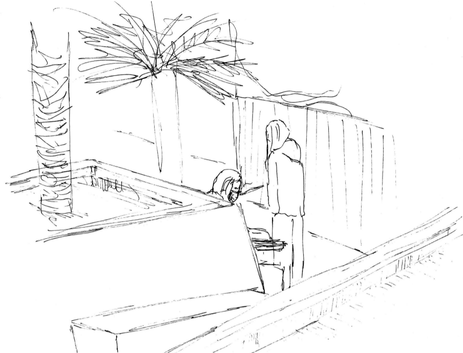
105. A pesar de la diferencia de altura entre los cuerpos, la cercanía entre ellos permanece y el foco de la conversación sigue, un acercamiento frente a frente para permanecer, ver y oír.

104. La disposición de los cuerpos y las miradas enfocadas en la otra hace parecer que están en una burbuja de intimidad en la amplitud de la calle . La conversación y las risas siguen sin importar el alrededor.