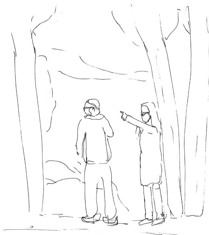
113. Lo llano del espacio permiten al cuerpo una libertad en la gestualidad y expresión, cada uno en su lugar pero cercanos al otro. La gestualidad guiada por el hablar hacen que el enfoque visual sea sobre algo externo a ellos. La simultaneidad de sentidos guían la conversación.

109. Entre árboles y arbustos, aparecen estas mujeres reposando sus cuerpos expectantes a la llegada de alguien, ubicadas justo entre dos árboles que permite una mirada libre hacia el punto que observan . Una conversación centrada e íntima entre ellas, pero con la vista enfocada en un tercero.