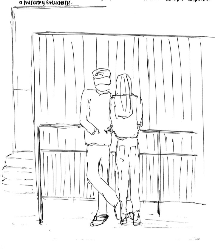
111. Sobre la reja, el cuerpo del hombre reposa para referirse de frente a la mujer, quien tiene su cuerpo direccionado a él. Una conversación íntima que se mantiene solo entre ellos por la cercanía y la facilidad de hacerlo. Cuerpos dispuestos a mirarse y escucharse.

111. Sobre la reja, el cuerpo del hombre reposa para referirse de frente a la mujer, quien tiene su cuerpo direccionado a él. Una conversación íntima que se mantiene solo entre ellos por la cercanía y la facilidad de hacerlo . Cuerpos dispuestos a mirarse y escucharse.