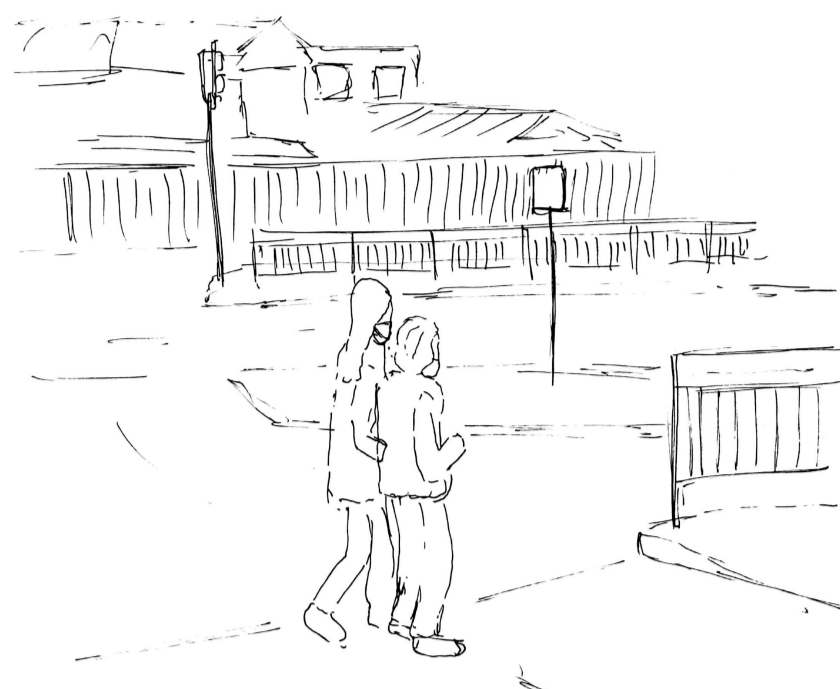
110. En la explanada de la calle, la joven se acerca a la anciana para ayudarla a cruzar. Una distancia muy próxima entre ellas sobre lo amplio del suelo, marcando un motivo y elección a este acercamiento.

105. A pesar de la diferencia de altura entre los cuerpos, la cercanía entre ellos permanece y el foco de la conversación sigue , un acercamiento frente a frente para permanecer, ver y oír.