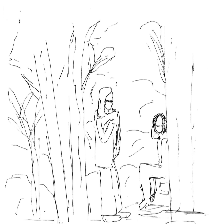
109. Entre árboles y arbustos, aparecen estas mujeres reposando sus cuerpos expectantes a la llegada de alguien, ubicadas justo entre dos árboles que permite una mirada libre hacia el punto que observan. Una conversación centrada e íntima entre ellas, pero con la vista enfocada en un tercero.

107. En lo amplio y libre del suelo de la plaza, el niño se despliega sobre él a modo de juego, su cuidador mientras se sienta sobre la orilla de una decoración para verlo de mejor manera para también participar de lo que hace el niño y hablar y reír.