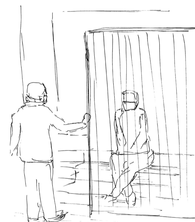
112. Frente a frente, los hombres se encuentran y conversan. Con el pasar de los minutos, cada uno de ellos se apodera del espacio en el que está y despliega su cuerpo sobre distintos objetos para reposar y enfocarse en lo hablado, quedando a niveles similares en lo extenso del lugar.

108. En lo amplio y libre de la calle , los hombres se extienden sobre esta y ocupan todo su espacio, cada uno en su lugar pero cercanos al otro para seguir la conversación enfocada en los árboles que señala uno de ellos.