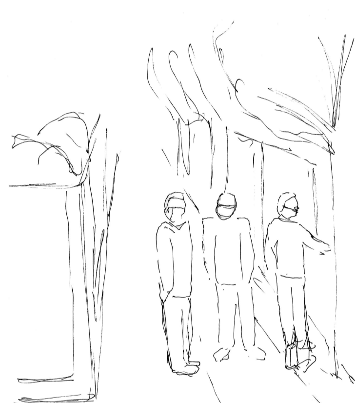
108. En lo amplio y libre de la calle, los hombres se extienden sobre esta y ocupan todo su espacio, cada uno en su lugar pero cercanos al otro para seguir la conversación enfocada en los árboles que señala uno de ellos.

113. Lo llano del espacio permiten al cuerpo una libertad en la gestualidad y expresión, cada uno en su lugar pero cercanos al otro. La gestualidad guiada por el hablar hacen que el enfoque visual sea sobre algo externo a ellos. La simultaneidad de sentidos guían la conversación.