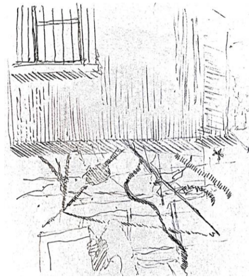
La imagen que se reproduce en la horizontalidad de la superficie se concibe a partir de una relación vertical con la incidente y una corporalidad en suspensión, es esta imagen la que revela de manera visual a través de sus características factores de la lumínica y sin parte de esta dinámica contenida se puede prever la ambientación | Relación vertical del habitar con la luz se reproduce en percepción horizontal que acostumbra contexto humano en el planeta.