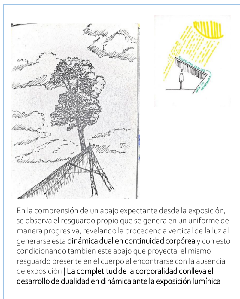
En la comprensión de un abajo expectante desde la exposición, se observa el resguardo propio que se genera en un uniforme de manera progresiva, revelando la procedencia vertical de la luz al generarse esta dinámica dual en continuidad corpórea y con esto condicionando también este abajo que proyecta el mismo resguardo presente en el cuerpo al encontrarse con la ausencia de exposición | La completitud de la corporalidad conlleva el desarrollo de dualidad en dinámica ante la exposición lumínica |

El encuentro del acto permanecer próximo en suspensión equilibrada, acogido por la condicionalidad de un abajo en dualidad de holgura encumbrada en lo expuesto da cabida a la construcción del curso del espacio estructural proyección expandida en desnivelación equilibrada, el cual a partir de su forma acoge la sombra en una levedad discontinua dispuesta hacia la estrechez, esto se observa en el desarrollo del abajo de la estructura que cuenta con una elevación la cual trae a presencia esta discontinuidad de la levedad de la sombra donde esta se hace presente en el desarrollo del abajo que suspende la plataforma encargada de acoger la carga externa que se soporta, en este caso un kilogramo de arroz, el cual se distiende en un permanecer que si bien se encuentra en una desnivelación, el estudio y aplicación de las leyes de estática (las cuales establecen que para que exista un correcto equilibrio en un cuerpo rígido la vertical que pasa por el centro de gravedad del cuerpo debe caer siempre dentro del polígono de apoyo o base de sustentación), permite mantener el equilibrio del cuerpo junto con el peso de este elemento que aporta una carga externa.