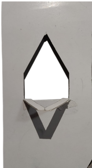
Soporte individual sin bocado

Se siguió desarrollando desde la naturaleza, buscaba dar en el soporte una caída como la de un petalo y que el bocado se sostuviese en él, lo suficiente para no caer pero tambien lo suficiente como para tener una inclinación que deje entender o invite un retiro. Inicialmente la concepción era dejar colgando con la fruta de un arbol y que el soporte en su completitud perdiera la facultad de trama, buscando tener un orden no determinado como lo es en una rama. No supe como ejecutar esta idea y creo que no era muy acorde a lo que estabamos haciendo.